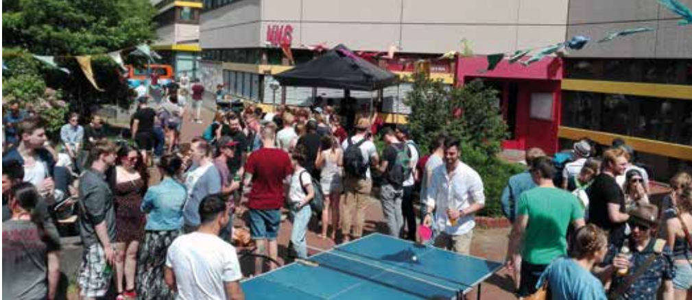
Studierende protestierten bei Bier und Eis für eine schnelle Wiedereröffnung des KKC.

Seit über einem halben Jahr ist das Kunst- und Kulturcafé (KKC) auf dem Essener Campus geschlossen (akduell berichtete). Eine Wiedereröffnung ist zwar geplant, doch bemängelt der Allgemeine Studierendenausschuss (AStA) die Zusammenarbeit mit dem Studierendenwerk. Währenddessen werden die Stimmen für einen baldigen Neustart immer lauter. Am vergangenen Donnerstag, 12. Mai, fand eine Protestparty mit gratis Bier und Eis direkt vorm KKC statt.