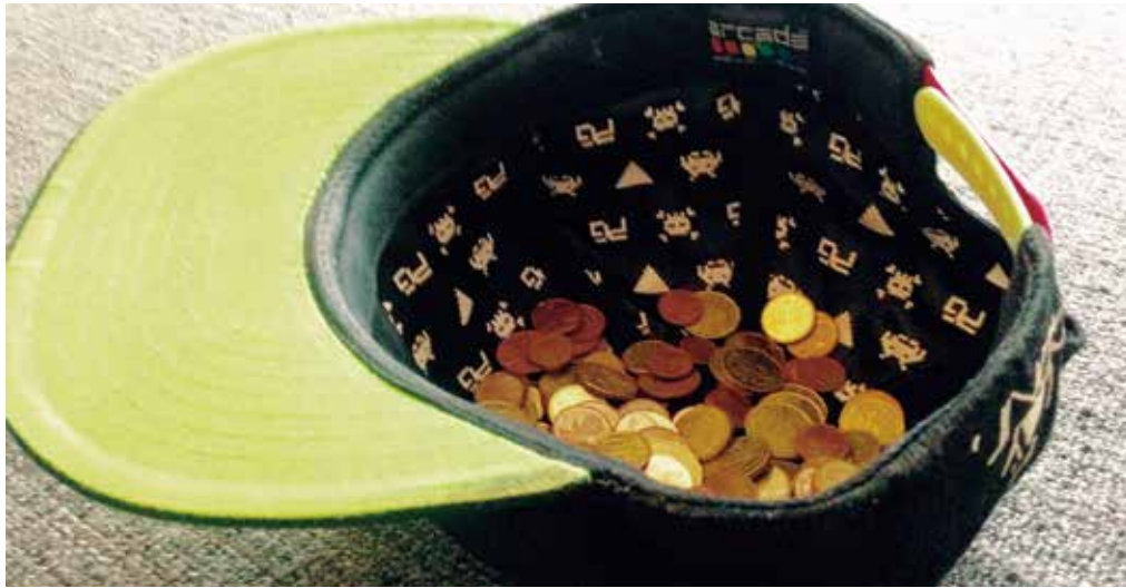
Manchmal reicht das Geld in der Spendenmütze einfach nicht aus.

Kunstschaffende werden von diesem Satz vermutlich in ihren schlimmsten Albträumen heimgesucht. Dass ihre Arbeit nicht oder nur sehr schlecht bezahlt wird, ist ein Klischee, das sich leider zu oft bewahrheitet. Aber warum gehen viele Menschen davon aus, dass es reicht, Musikmachende, Malende oder Vortragende auf die Bühne zu stellen und im Nachhinein dafür nicht zu entlohnen?