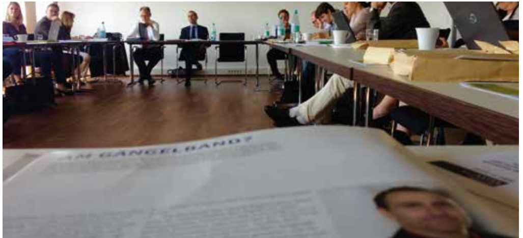
Ausgabe des Campus Reports auf der Senatsitzung: Der Vorsitzende des Gremiums hatte kritisiert, dass vor allem Professor*innen hier die Arbeit leisten würden. Studierende kritisieren die Äußerung scharf.

Gleich zu Beginn der Sitzung hatten die Studierendenvertreter*innen zudem ein anderes Senatsmitglied ebenfalls scharf kritisiert. Ein Professor soll auf der vergangenen Sitzung schwarze Menschen durch das rassistische N-Wort diskriminiert haben. Er echauffierte sich zuvor über die geschlechtergerechte Besetzung von Listen