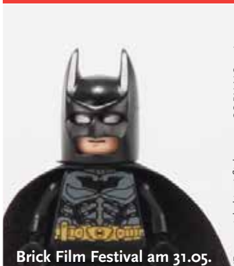
Brick Film Festival am 31.05.