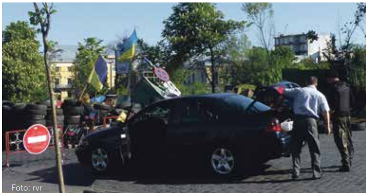
Checkpoint der Selbstverteidigungstruppen des Maidan. Wer hier lang fahren will, wird durchsucht.