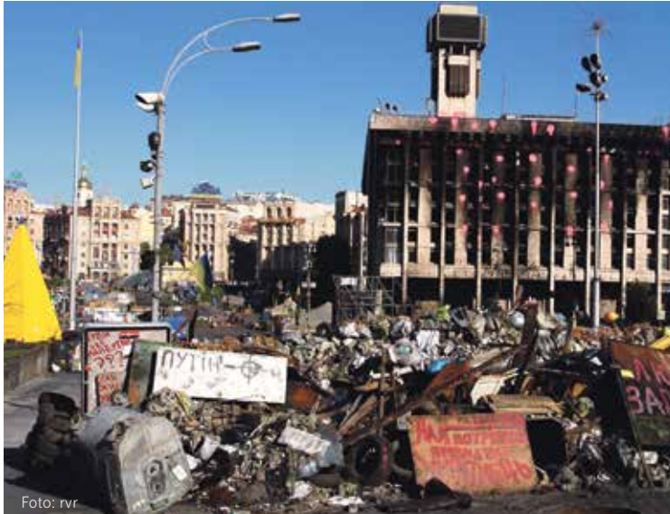
Barrikaden versperren den Zugang zum Maidan. Im Hintergrund: Das ausgebrannte Gewerkschaftshaus, das der Opposition als Hauptquartier diente.