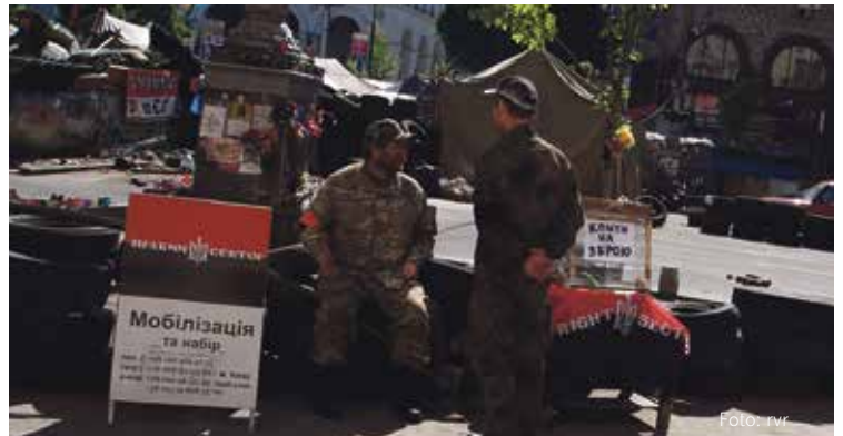
Mitglieder des Rechten Sektors. Die militant rechte Gruppe ist auf dem Maidan nicht in der Mehrheit, aber sichtbar präsent.