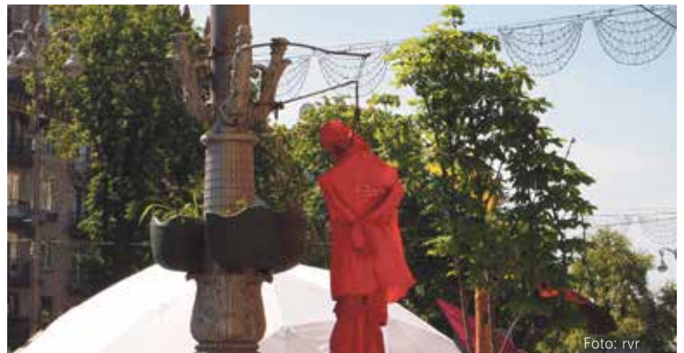
Symbolisch an der Laterne aufgeknüpft: Eine Figur in der Uniform der Kommunistischen Partei der Ukraine.