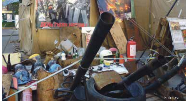
Selbstgebaute Kanonen, mit denen Molotow-Cocktails verschossen werden können. Dahinter: Utensilien zum Bau von Molotow-Cocktails.