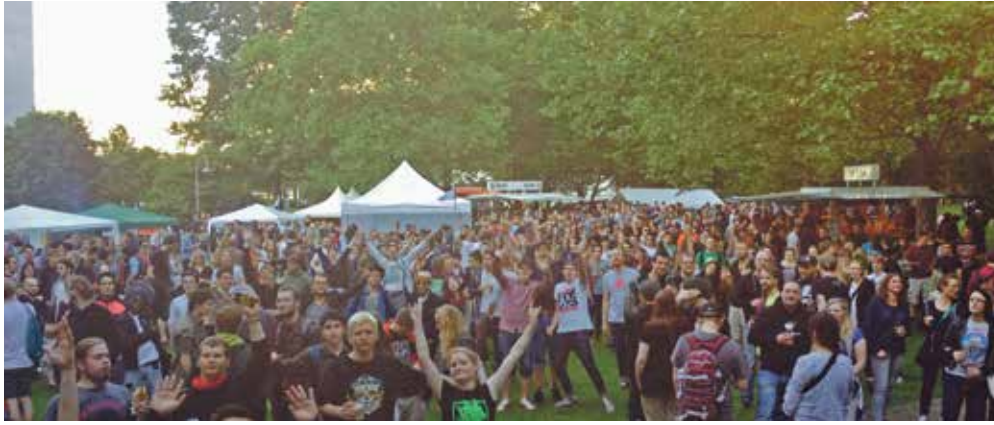
Von der Bühne aus haben wir dieses Foto von euch geschossen. Wie versprochen findet ihr es hier auf Seite 8.