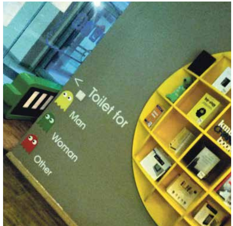
Auf öffentlichen Toiletten wird die Diskriminierung sichtbar: Die Belange von Trans* und Inter* werden gesellschaftlich oft nicht wahrgenommen.

Als im vergangenen Jahr in Frankreich die Ehe für gleichgeschlechtliche Paare geöffnet wurde, entwickelte sich dort eine konservative Massenbewegung, die mehrfach Zehntausende mobilisierte. Die „Manif pour tous“ will nun zur gesamteuropäischen Bewegung wachsen. Den deutschen Ableger „Demo für Alle“ leitet unter Anderen AfD-Frontfrau Beatrix von Storch. Hierzulande sprang das rechte Bündnis auf den Zug der süddeutschen Proteste gegen die neoemanzipative Sexualpädagogik