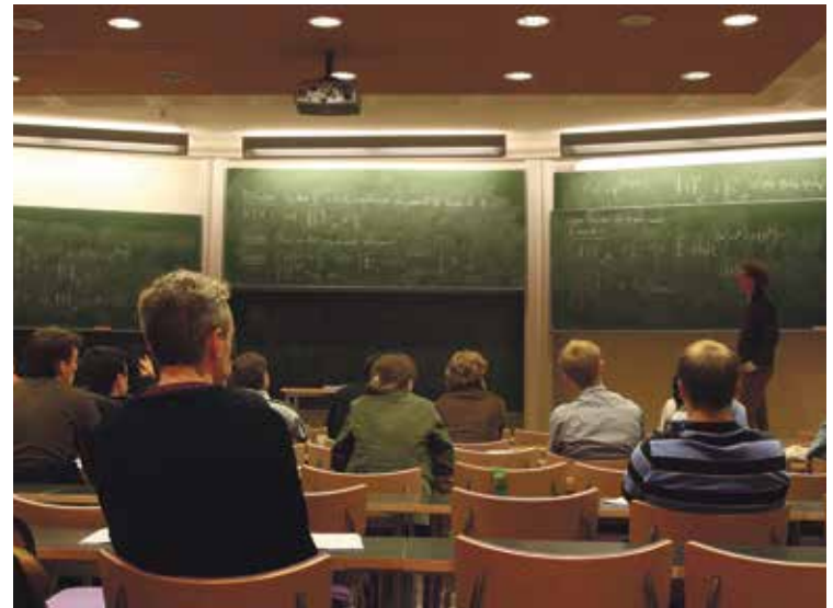
Offline war gestern: An der Minerva University wird nur noch am Rechner gelernt.

Das Start-Up-Projekt, einst mit 25.000 Millionen Dollar Risikokapital gestartet, erfreut sich wei-