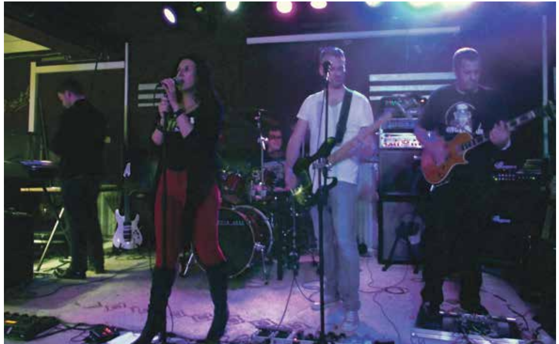
Rockmusik von damals und heute: stroke unit bei der Jim Jams-Session im Duisburger AStA-Keller.

Anschließend kommt es zum Hauptteil der Sessions, den nicht mehr professionelle Musiker*innen übernehmen, sondern Studierende selbst. „Im Laufe der Zeit haben sich schon mehrere Studierenden-Bands gegründet, die Musik von Gitarre über Jazz bis Rap machen“, sagt Volodko, der selber seit einem Jahr Bass spielt. Die Auftritte der verschiedenen Bands sind aber nur als Warm-Up zu verstehen. Der Höhepunkt der Sessions ist das gemeinsame Musizieren. „Jede der Teilnehmerinnen ist herzlich dazu eingeladen, auch selber Musik zu machen. Auch wenn man noch unsicher ist: hier sind viele helfende Hände“, erklärt er. „Ich selbst habe auch hier erst das Bassspielen gelernt. Wenn du Leute in deiner Umgebung hast, die das können, geht das Lernen gleich viel