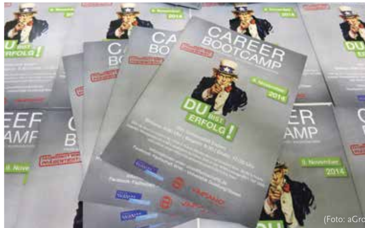
Motivation oder Humbug? Das Career Bootcamp war vieles, nur nicht langweilig.