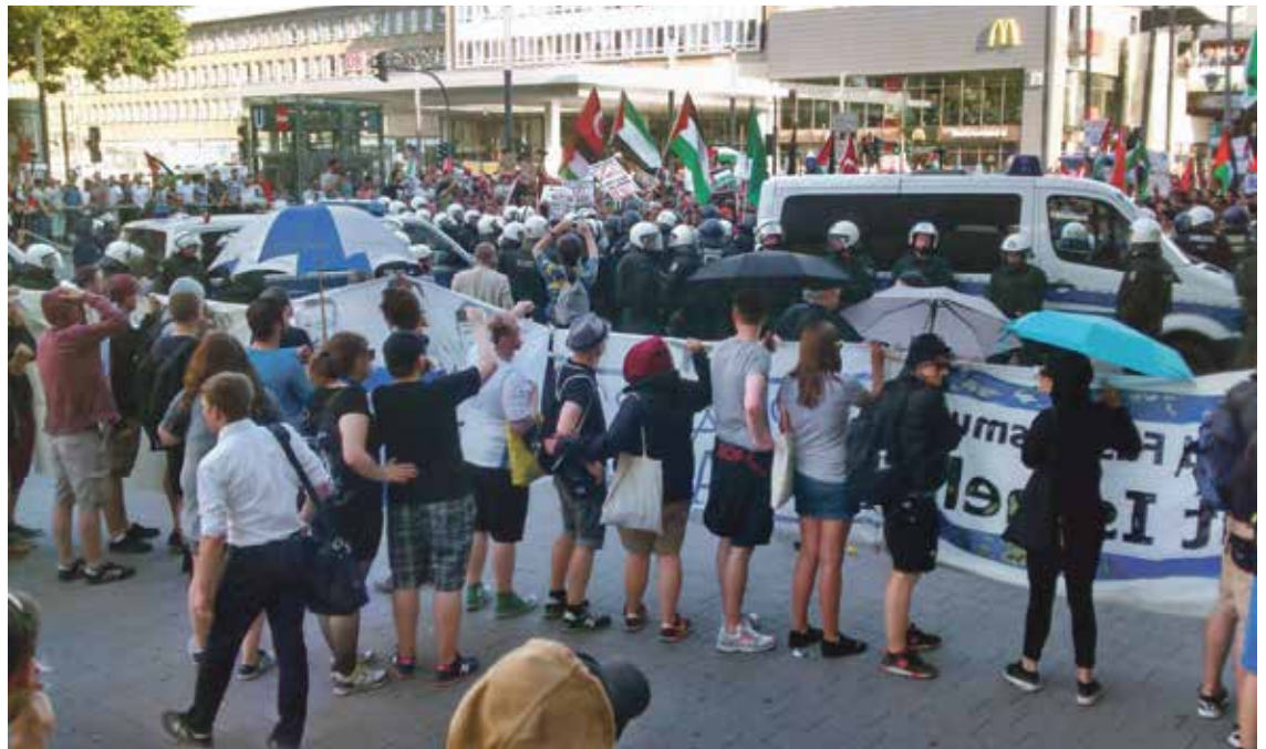
Essen, 18. Juli 2014. Auf vielen Demonstrationen kam es im Sommer zu antisemitischen Vorfällen.

Vielen dieser Vorfälle diente wie so oft NRW als Schauplatz. In Essen musste eine Israel-solidarische Kundgebung mit gerade mal 100-200 Teilnehmer*innen mehrere Stunden in einem Polizeikessel ausharren, während tausende Gegendemonstrant*innen zu ihnen zu gelangen versuchten und mit verschiedensten Gegenständen warfen (akuell berich-