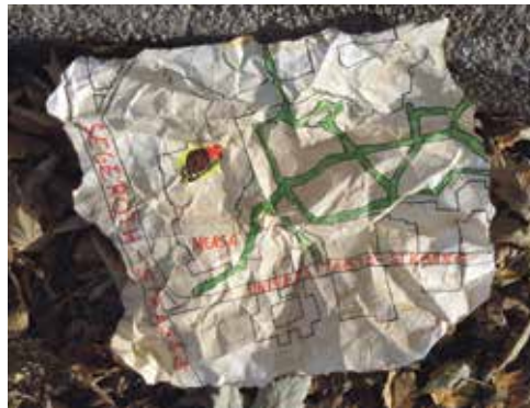
Wie sich am Ende herausstellte gibt es einen kürzeren Weg von der Segerothstr.

Kurzentschlossen schlage ich den Weg zum Studierendenservice ein, finde stattdessen jedoch die Zentralstelle für Allgemeine Studienberatung. Dort könnte man mir sicherlich weiterhelfen – jedoch nicht an einem Freitag nach 12 Uhr. So treffe ich dort, statt informierten Menschen, nur ein übergroßes Schachbrett an. Da die Beschilderung bisher nicht hilfreich war, weil nicht vorhanden, hilft scheinbar nur eines: fragen. Beim Waffelstand ist nicht nur Proviant für die weitere Tour zu erstehen, dort gibt es auch Informationen. „Auf jeden Fall im Keller, du musst eine Etage tiefer“, so der Hinweis der Teigwarenproduzentin. Doch ob dies die richtige Fährte ist, bleibt ungewiss: sie gibt zu, selbst noch nie den geheimnisvollen Ort betreten zu haben. Die neue Schwierigkeit liegt im Auffinden einer Treppe, welche nach unten führt. Schließlich auf der Ebene -1 angekommen, treffe ich auf eine Brandschutztür und den Raum ‚Bauangelegenheiten Handwerkergruppe T-01 R1 CX 9‘. Schnell wieder hoch. Dann der erhsehnte Moment: Im roten Aufzug, hinter der gelben Tür zwischen Mensa und Café Giallo, lese ich zum ersten Mal das Wort Fundbüro. Erneut im Keller kommen Pfeile hinzu, die Beschilderung weist mir tatsächlich den Weg zu ‚Poststelle, Fundbüro, Fahrdienstleitung‘. Die Lüftung dröhnt, es wummert, ich