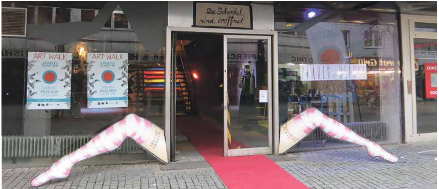
Die Schenkel sind eröffnet: Diese Ausstellung geht unter die Gürtellinie

Der ehemalige Sex-Shop „Delphi Palast“ in Essen steht bereits seit 2006 leer. Am vergangenen Wochenende wurde das baufällige Gebäude in der Viehofer Straße neu belebt und bot die passende Kulisse für eine bemerkenswerte Kunstausstellung. Unter dem Titel „Pearls of Delphi“ zeigten über 20 meist junge Künstlerinnen aus der Region hier Werke zum Thema Weiblichkeit. Neben Bildern, Mode und raumfüllenden Installationen standen Performances von Lesung bis hin zu Pole-Dance auf dem Programm. Nach zwei erfolgreichen Öffnungstagen ist eine Verlängerung im Gespräch.