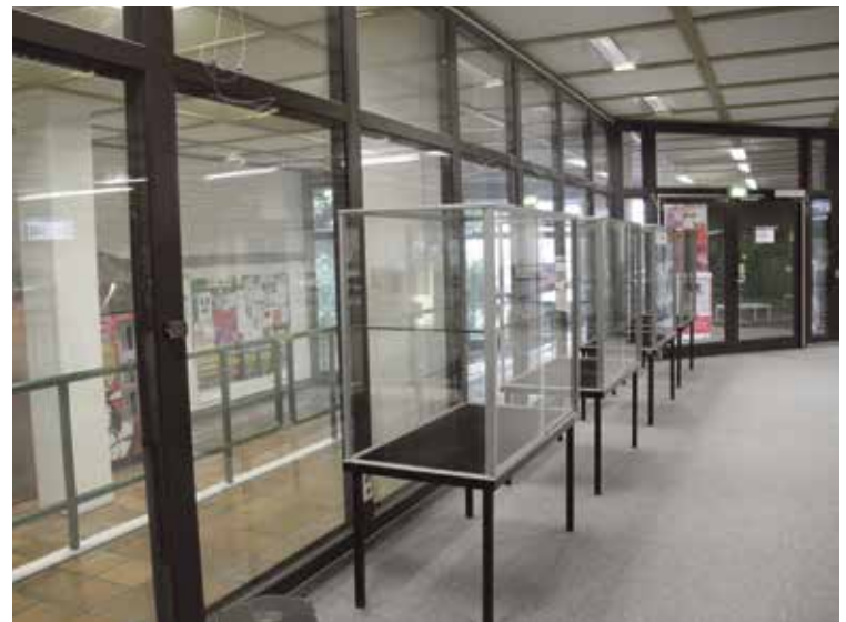
Breite Öffentlichkeit für leere Kästen: Der Bibliotheksvorraum nach Abbruch der Comic-Präsentation.

Danach überschlug sich die Presse in ihren Deutungen zum Vorfall. Von regionalen Medien wie WAZ und RTL West bis zu überregionalen Medien wie der FAZ, dem ZDF und der Welt: Das Thema bekam eine breite Aufmerksamkeit. Statt um den Vorfall auf dem Essener Campus ging es nun in Print, Funk und Fernsehen um die Verteidigung „westlicher Werte“ und „unserer Kultur“.