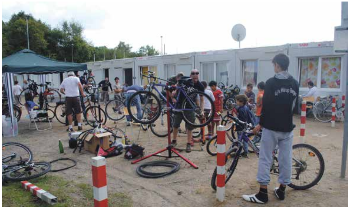
So kann Nachbarschaftshilfe aussehen: gemeinsam mit den Bewohner*innen der Container reparieren Nachbarn-Fahrräder an der Wohlfahrtstraße.

Zur 8. Integrationskonferenz – dieses Mal zum Thema „Flüchtlinge“ – hatte die Stadt Bochum in den großen Sitzungssaal des Rathauses geladen. Die Veranstaltung war mit mehr als 150 Teilnehmer*innen die bisher bestbesuchte Integrationskonferenz der Stadt. Trotz des überdurchschnittlich großen Interesses seitens verschiedenster ehren- und hauptamtlicher Initiativen aus den Bereichen Flüchtlingsarbeit und Integration, lieferte die Konferenz nur wenige konkrete Vorschläge für den von Oberbürgermeisterin Otilie Scholz (SPD) angekündigten Perspektivwechsel. Neben Lob für das ehrenamtliche Engagement an den Bochumer Notunterkünften hagelte es auch Kritik an der städtischen Politik.