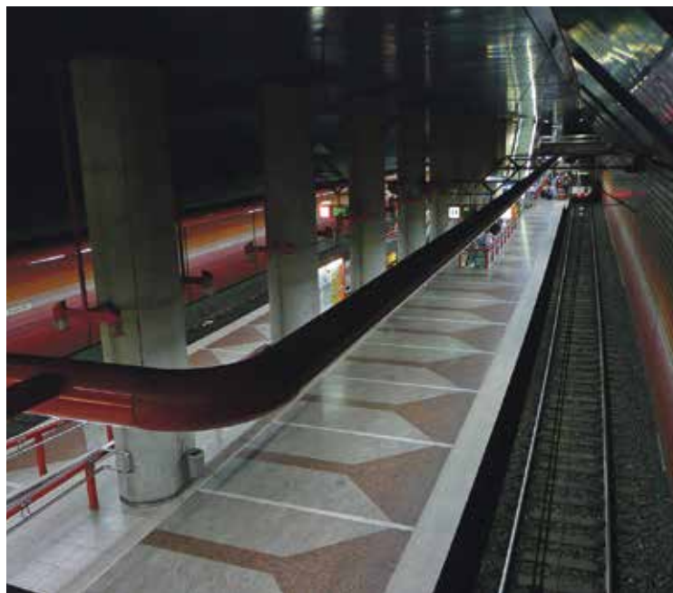
Schicht im Schacht? Fahren Duisburger Bahnen demnächst nur noch überirdisch?

Das computergesteuerte Zug sicherungssystem ist veraltet und benötigt nach über 20 Jahren Betriebslaufzeit nun eine Sanierung. Die Kosten von ungefähr 40 Millionen Euro könne die Stadt jedoch nicht aufbringen. Die zwingend notwendige Sanierung muss aber schnellstmöglich beginnen. Immerhin sieht sich die Herstellerfirma nur noch ein knappes Jahr in der Lage, Ersatz-