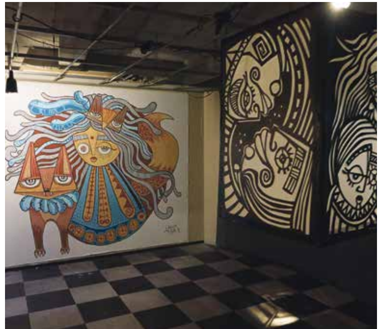
„It is what it is“ - Ursula Meyer lässt ihre Bilder für sich sprechen